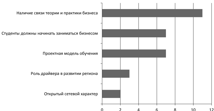
Рис. 3. Отличия предпринимательского университета от других вузов (количество выборов) Fig. 3. Distinctions of an entrepreneurial university from other universities (number of elections)

онного клуба предпринимателей, оказание консультаций, дополнительное образование, институт менторства и другие форматы.