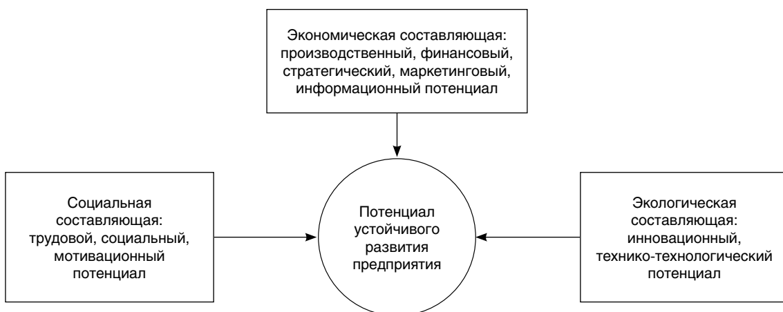
Рис. 2. Структура потенциала устойчивого развития предприятия химической отрасли