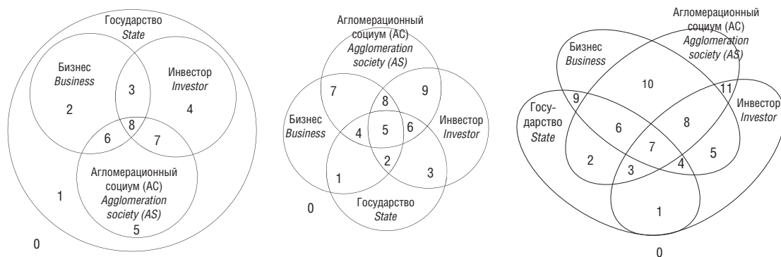
Рис. 3. Стратегическое взаимодействие участников землепользования в агломерациях